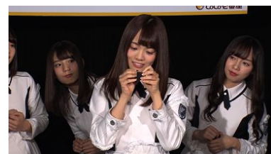
※ポスター掲示は一部店舗を除く

詳細はキャンペーンサイト ( https://www.ichibanya.co.jp/cp/keyakizaka46/ ) をご覧ください。