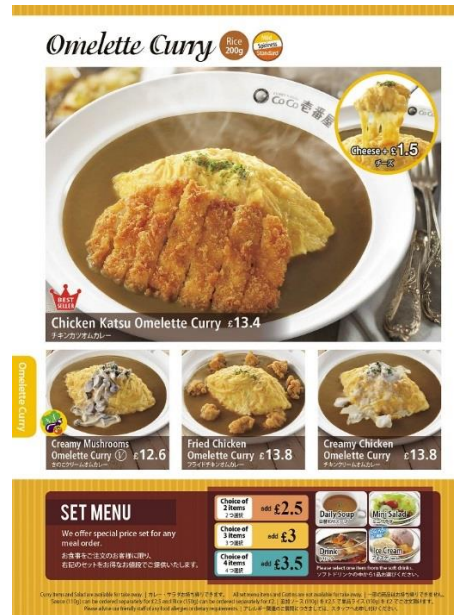
【メニュー例（メニューブックより抜粋）】