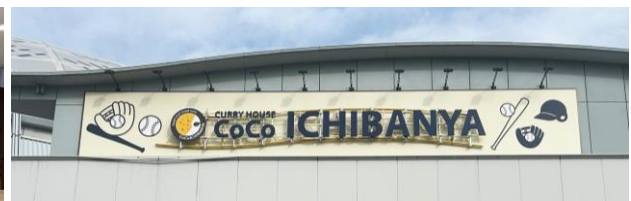
リニューアル後のナゴヤドーム店外観（上） 内観（下・左）／看板（下・右）